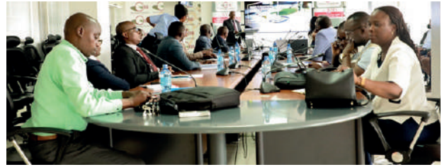
Vue du parterre des participants

portle projet, a fait recours à une expertise qui sera faite par une maison tunisienne spécialisée en la matière. Il s'agit de AMC Ernst & Young ( EY ). Celle-ci travaillera de connivence avec l'équipe-projet e-KORI de l'OBR sur cette période de 27 mois en vue de mettre sur pieds cette digitalisation.