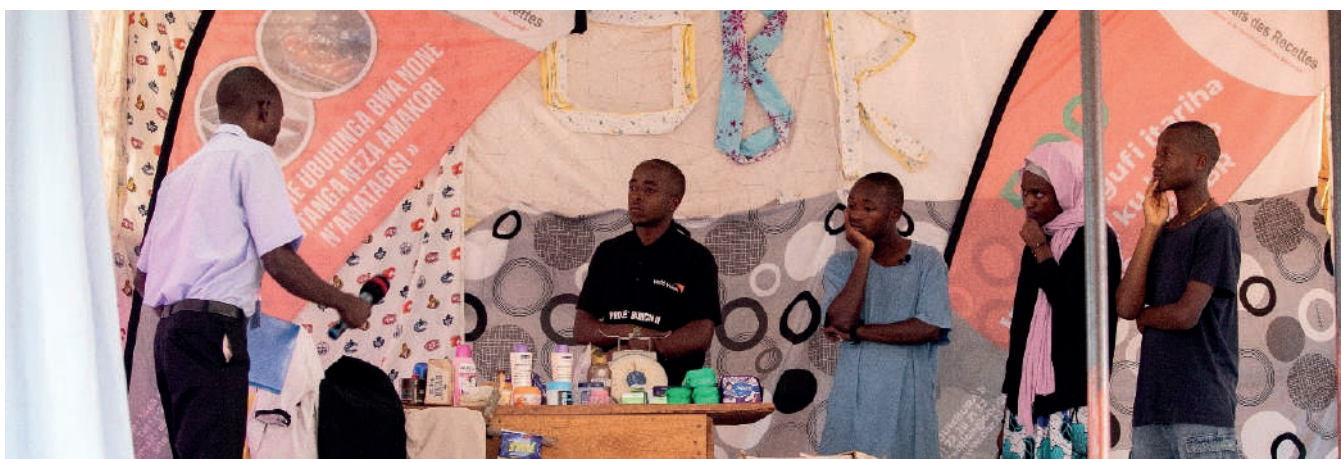
Igice c'igikino cerekanywe n'abanyeshure bo kuri Lycée Gisanze

Ayandi mashure yari yitabiriye ihiganwa akaba ari Ecole d'excellence ryo mu Rusengo/Ruyigi, Iseminari Ntoya yitiriwe Umweranda Piyo w'10 y'i Muyinga, Lycée Gisanze na Lycée Communal ya Giteranyi. Uwo musu nyene, mu ntara ya Burunga ayandi mashure 5 yariko arahiganirwa ikibanza co muri ico gice ca nyuma; aho naho Lycée d'Excellence y'i Makamba ikaba ariyo yatahukanye itike yo kuja mu gice ca nyuma.