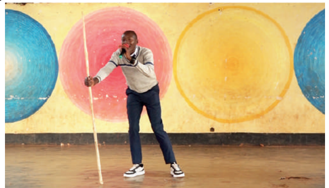
Un élève du Lycée d'Excellence Musinzira présentant "Amazina"

Cette finale des jeux concours prévue pour le 14 février 2026 coïncide avec le 10ème anniversaire de la création de ces épreuves, initiées en 2016 par l'Office Burundais des Recettes. En définitive c'est 5 clubs Amis du Fisc représentant les écoles dont une par province qui participeront dans ces jeux. Il s'agit de celui de l'Ecole d'Excellence de Makamba pour la province Burunga, celui du Lycée du Saint Esprit et celui du Lycée Gisenyi pour la province de Bujumbura, celui du Lycée Bukirasazi pour Gitega, celui du Lycée Don Bosco pour Butanyerera et celui du Lycée de Rugari en représentation de Buhumuza.