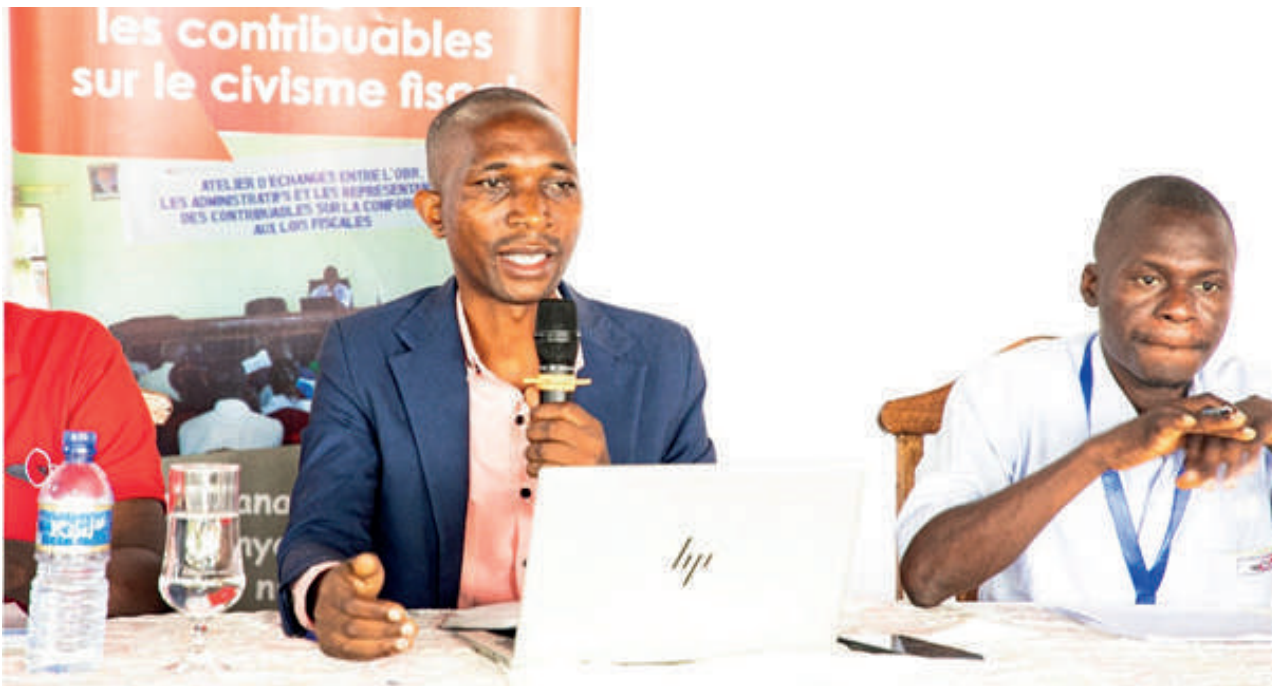
Au premier plan à gauche, M. Ferdinand Nitunga, Commissaire ai chargé des taxes internes et des recettes non fiscales

La taxe sur la valeur ajoutée n'est pas payée par toutes les catégories de contribuables. Celle-ci est payée par les contribuables disposant un chiffre d'affaire d'à partir plus de 100 millions BIF comme l'a bien expliqué Ferdinand Nitunga.