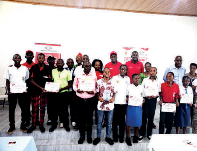
Photo de famille après la remise des certificats de mérite, un trophée et des prix aux gagnants