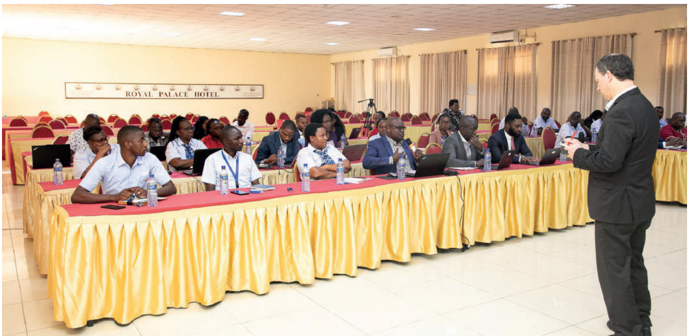
Vue d'ensemble des participants

Ainsi, les Etats du Sud comme le Burundi ne tirent pas donc des dividendes palpables puisqu'étant minoritaires, ce qui constitue des inconvénients. Comme l'évoque Monsieur Andrew Bauer, expert en finances publiques et en fiscalité du secteur extractif à la banque mondiale, c'est désavantageant pour les Etats qui n'en tirent pas des dividendes.