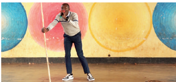
Umunyeshure wo kuri du Lycée d’Excellence Musinzira ariko arivuga amazina

Ico gice ca nyuma c’urwo rukino cari gitegekanyijwe kw’igenekerezo rya 14 Ruhuhuma 2026 kikaba cahurirana n’imyaka 10 irangiye kuva iyo mirwi ishinzwe, itangujwe n’Ikigo OBR mu mwaka w’2016. Imperuka rero imirwi 5 y’abagenzi b’amakori iserukira ishure rimwe rimwe kuri buri ntara ikaba ari yo yemerewe kuzitabira igice ca nyuma c’izo nkino.