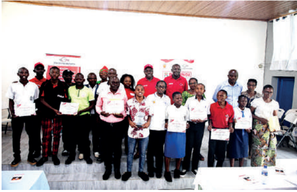
Ifoto y'umuryango inyuma yo gushikiriza ubushimwe n'impuro z'iteka atahukanye intsinzi