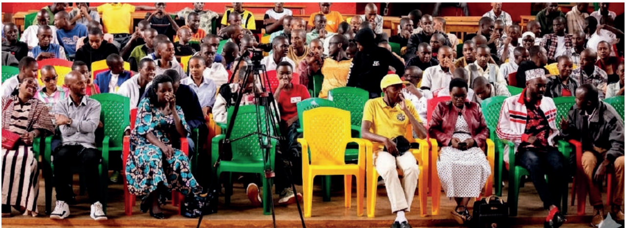
Vue des spectateurs au Lycée Don Bosco

Au même moment, dans la province Gitega dans la salle du Lycée d'Excellence Musinzira, cinq clubs Amis du Fisc représentant 5 établissements croisaient le fer pour une place en finale remportée par le Club du Lycée Bukirasazi. Les autres candidats étaient du Lycée hôte d'Excellence Musinzira, du Lycée Gishubi, de l'ECOSO Gitega et de l'ITAB Karusi.