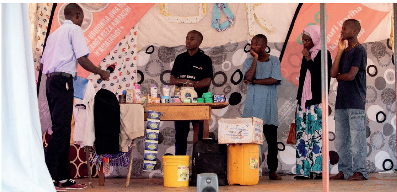
Scène de présentation d'un sketch par les élèves du Lycée Busiga

A la même date en province de Burunga, 5 autres établissements scolaires étaient en compétition pour une place en finale, et c'est le Lycée d'Excellence de Makamba qui a décroché son billet pour la finale.