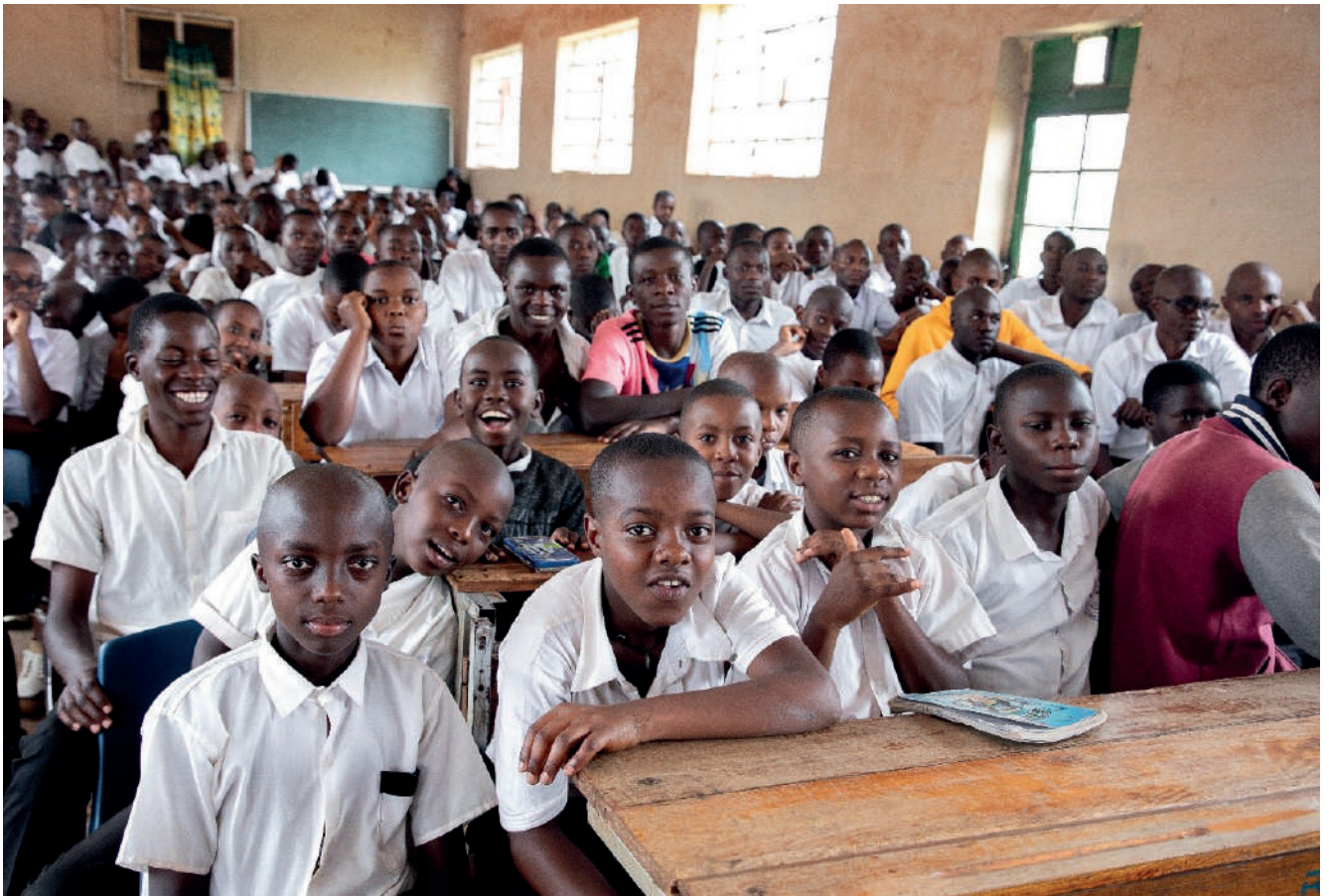
Akanyamuneza karanze abanyeshure bo kuri Lycée Rugari bahejeje kwemererwa kuzoja mu gice ca nyuma c'urukino