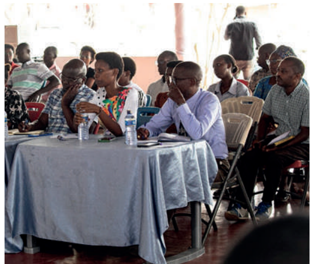
Vue des participants

L'on notera qu'au-delà de ces anomalies constatées, les dirigeants de l'OBR se réjouissent du fait que les contribuables ont évolué dans la manière dont ils perçoivent l'OBR et ses missions ; que maintenant ils accueillent les agents de l'OBR tranquillement et à bras ouverts, contrairement aux anciens temps où ils les attaquaient, leur lançaient des cailloux et les menaçaient comme s'ils venaient à leur propre mission. Ce qui permet une très bonne collaboration entre les agents de l'OBR et les contribuables comme l'a affirmé le Porte-Parole de l'OBR.