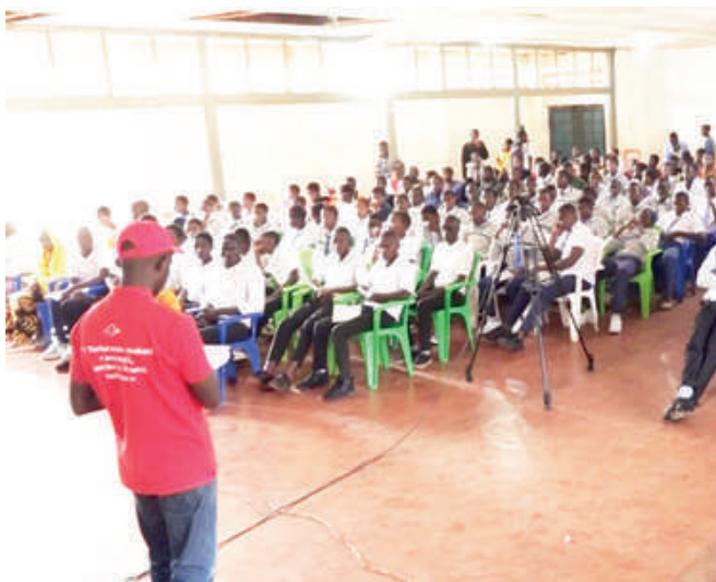
Vue des spectateurs au Lycée d'Excellence Musinzira