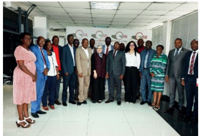
Ishusho ya bamwe mu bitavye inama