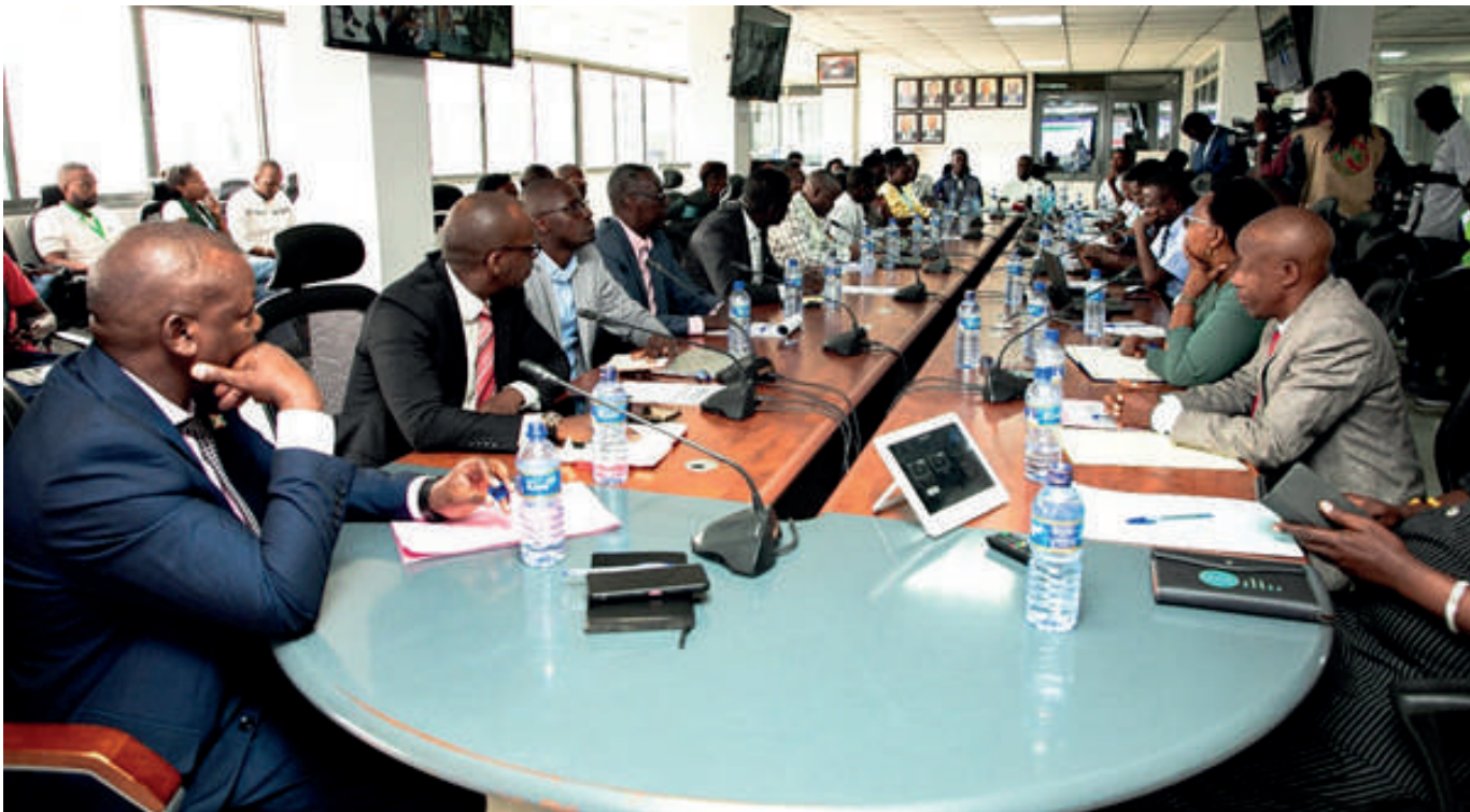
Ishusho y'ibikorwa igihe urwo rubuga rwariho rurerekanwa

guwe hanze babicisha mu mashini. Ikigo kijejwe itunganywa ry'imiti n'ibiribwa mu Burundi ABREMA kikaba gifise uruhara rudasanzwe mu gukorana neza n'ikigo OBR, ama banki n'amashirahamwe akorana na duwane mu gufasha abinjiza ibiriha ikori. Ubu rero kuva kw'igenekerezo rya 18 Ruhuhuma 2026 uwinjiza imiti mu gihugu wese ategerezwa kubicisha muri ubwo buhinga bwemewe bugeze kumusozi mw'ihinyanyugwa nkuko bimenyeshwa na Dédith Mbo-nyingiro umuyobozi Mukuru w'ikigo ABREMA.