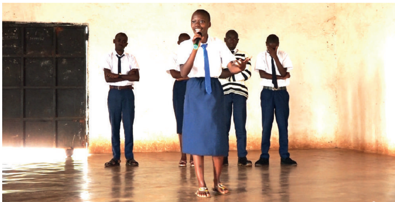
Une scène de présentation de Slam au Lycée d'Excellence Makamba