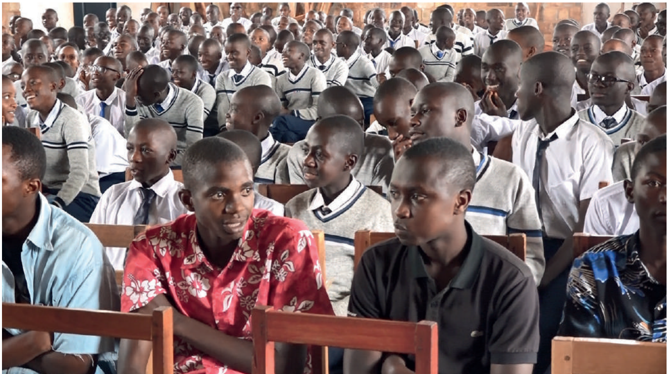
Uruhande rumwe rw'abaronererezi kuri Lycée d'Excellence Makamba