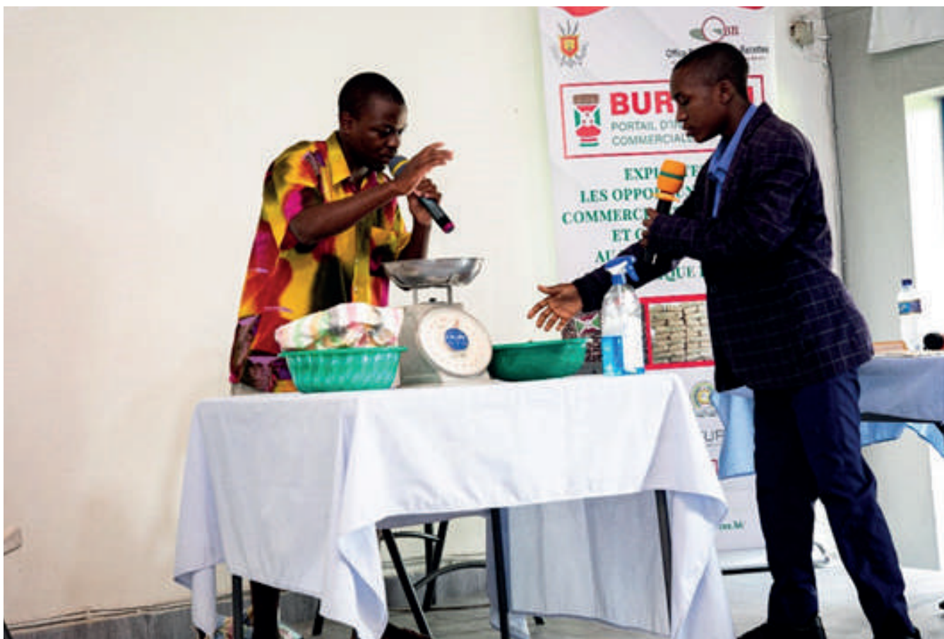
Les élèves lors des prestations pendant la Finale des jeux-concours

Une ambiance bon enfant a caractérisé cette compétition où des numéros remplis de divertissements ont été présentés par ces clubs. Des critères dans l'attribution de la note aux compétiteurs avaient été retenus ; tâche difficile d'autant plus que ces 7 représentants à travers toute l'étendue du pays étaient tous excellents.