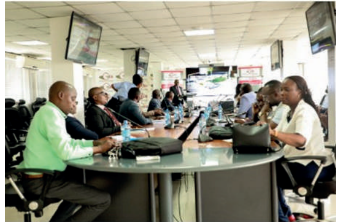
Ishusho ya bamwe mu bitavye iyo nama

Iryo shirahamwe rishigikira ikigo OBR muri uyo mugambi, ryarasavye ubufasha igihugu ca Tiniziya kimenyereye gukoresha ubwo buhinga. Iryo shirahamwe ryitwa EY mu mpfunyap-funyo, rikazoguma hafi umurwi w'ikigo OBR ukurikirana ishishirahamwe ry'umugambi e-kori mu kiringo c'amezi 27 uyo mugambi uzomara.