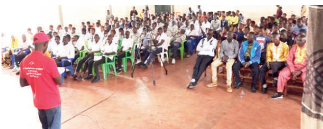
Isanamu y’abarorerizi kuri Lycée d’Excellence Musinzira