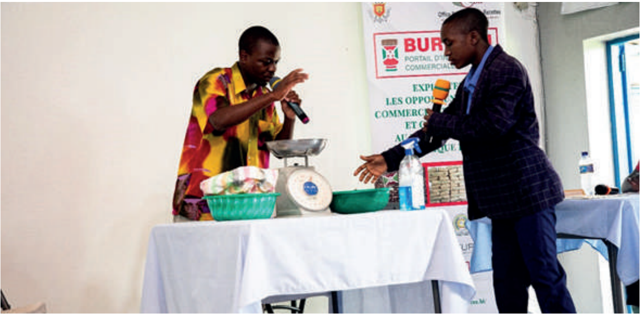
Abanyeshure bariko barerekana ibikino mu gice ca nyuma c'inkino-higanwa

munal yo ku Magara, Lycée Bukirasazi na Ecole d'Excellence y'i Makamba. Kabaye akaryo keza kuri abo banyeshure ko kugaragaza ingabire zabo babicishije mu dukino, amazina, n'indirimo zivuga ivy'ugukunda gutanga amakori n'amatagisi ku gushaka. Iryo higanwa ryabaye irya kivandimwe aho udukino two kwinezereza twashikirijwe n'imirwi itandukanye. N'aho umurwi wari ujeje gutanga amanota ku bahiganwa wari wagerageje gutegura ivyofatirwako, ico gikorwa nticari coroshe kuko iyo mirwi yose ukwo ari indwi yari yaserukiye igihugu cose yose yabikinye neza cane.