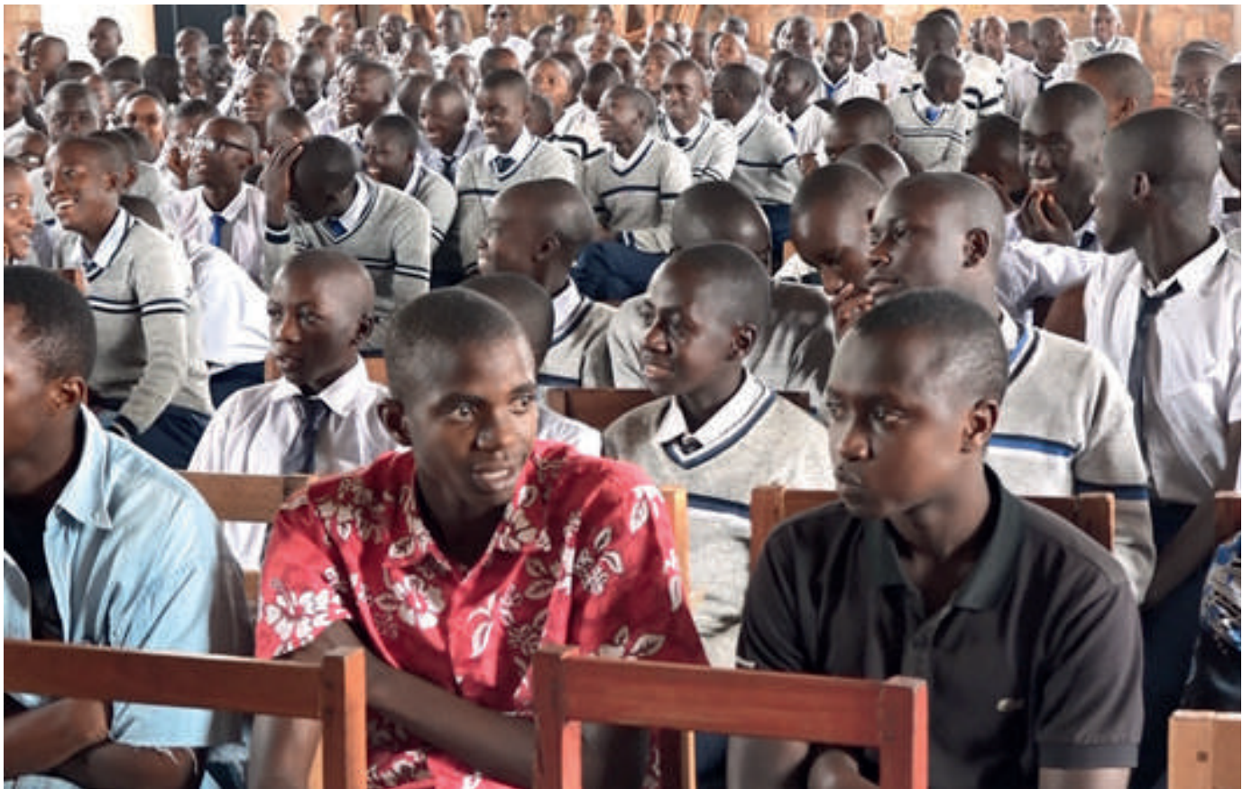
Vue partielle des spectateurs au Lycée d'Excellence Makamba