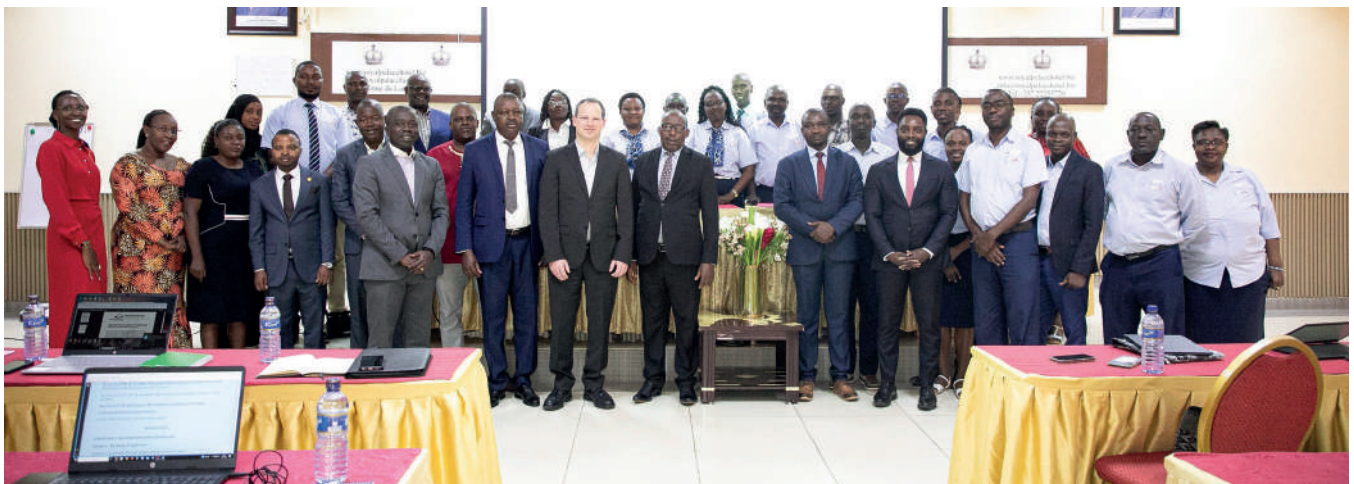
Ishusho y'abitavye inama

tare. » ivyo vyashikirijwe na Andrew Bauer, umuhinga akorera ibanki y'isi mu bijanye n'ubutunzi rusangi hamwe n'amakori n'amatagisi ava mu butare. Komiseri mukuru w'ikigo OBR mw'ijambo ryo kwugurura ivyo bikorwa yarashimiye ibanki y'isi ku ntererano yayo mu gukarirahira ubwenge abakozi b'ikigo OBR ku bijanye n'ugutoza amakori n'amatagisi ava mu butare. Igisata muri ibi bihe kiriko kiragerageza kuva mu buhinga bwa kera kija mu buhinga bwa none, ati ubu bikaba bikiri mu ntango nkuko yabishikirije.