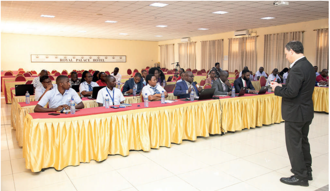
Ishusho ya bamwe mu bitavye inama