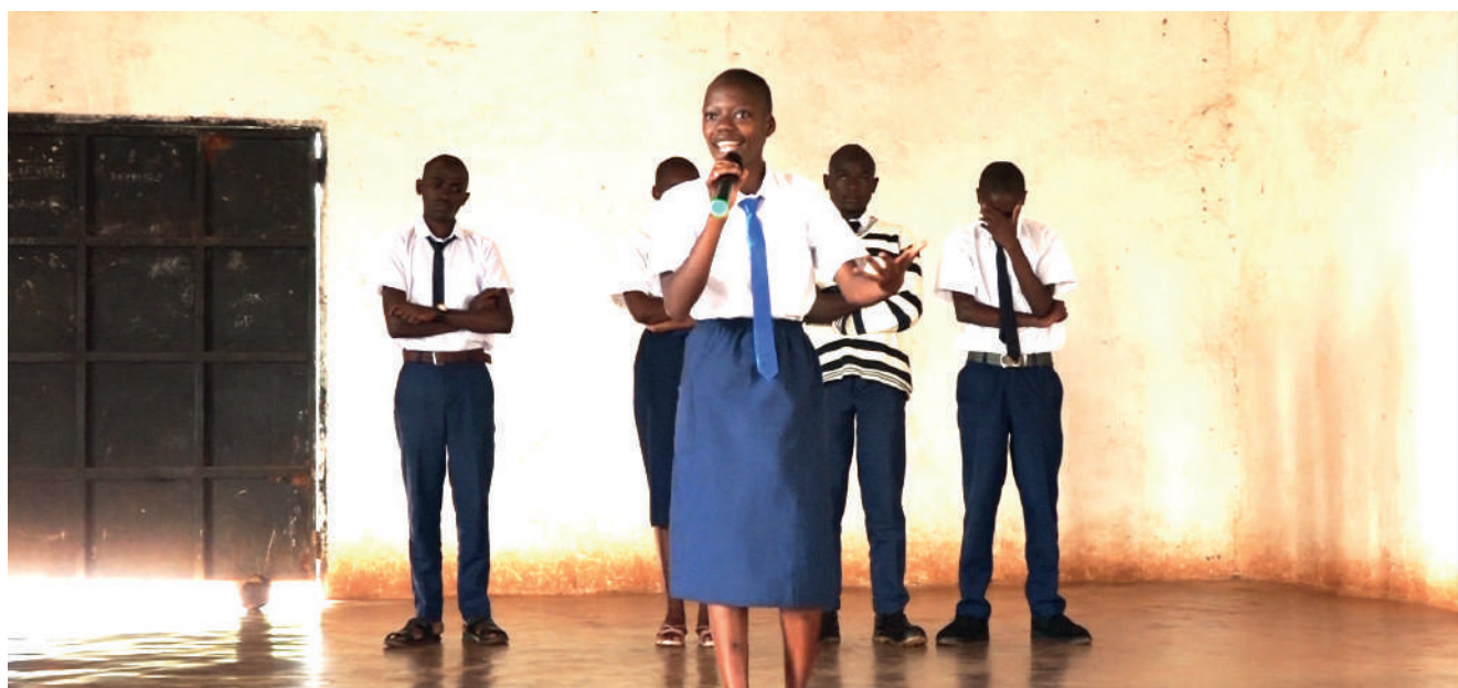
Umunyeshure yariko arivuga amazina kuri Lycée d'Excellence Makamba