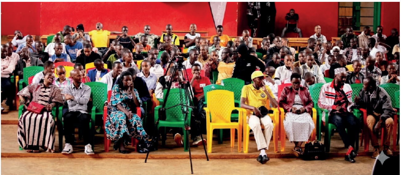
Isanamu y’abarorerizi b’ivyo bikino kuri Lycée Don Bosco

Ako kanya nyene, mu nzu y’amanama ya Lycée d’Excellence Musinzira mu ntara ya Gitega, imirwi 5 iserukira amashure yisumbuye 5 yariko iratana mu mitwe iharanira ikibanza co mu gice ca nyuma c’urukino, cahavuye gitahukanwa na Lycée Bukirasazi. Abandi bari bitabiriye ihiganwa bakaba ari iryo shure nyene ryari ryakiriye ihiganwa ari ryo Lycée d’Excellence Musinzira, Lycée ya Gishubi, ECOSO y’i Gitega na ITAB Karusi.