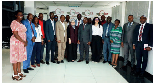
Photo de famille des invités présents